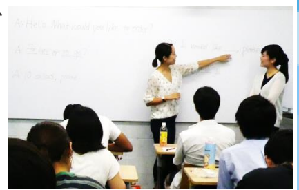
TTの模擬授業の様子

本学SALC (Self-Access Learning Center) ・教職課程・児童英語教員養成課程の教員が共同で運営し、実際に参加した学生からは、「ALTとの限られた打ち合わせ時間の中で、レスポンスを的確に伝えることの難しさ・重要さを感じた」、「試験前にこのような機会を得られてよかった」などの感想がありました。教員採用試験の本番に向けて、それぞれの課題や成果を得ることができたようでした。