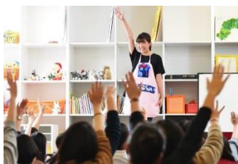
千葉経済大学短期大学部での授業の様子