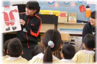
昨年度「児童英語教育実践」の様子 (於 福島県天栄村内幼稚園・小学校)