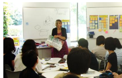
アメリカCA州公立小学校教諭による講習の様子

4では、シンポジウム・講演・ワークショップなど様々な形式で、最先端の研究結果等を踏まえたイベントを開催しています。