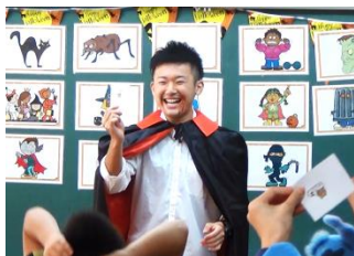
過去の実習生の様子 (於 船橋市内小学校)