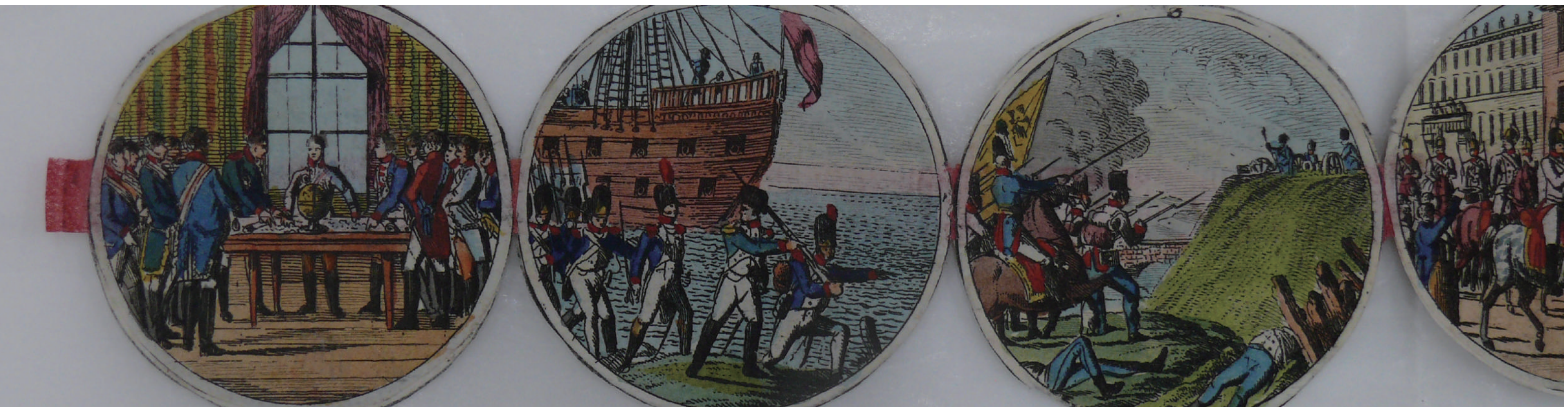
1815年ナポレオン戦役銅版図 1816年か