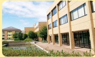
1号館 (右側) 外観