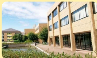
1号館 (右側) 外観