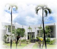
沖縄アミークスインターナショナル 幼稚園・小学校・中学校校舎

公立小学校で英語が教科となり、早期における英語教育への期待がますます高まっています。学習環境は子どもの能力の育成に大きな影響を及ぼすことで知られていますが、「英語イマージョン教育」を受けている子どもたちの学びはどのようなもののでしょうか。本講演は、本学の「児童英語教員養成課程」の実習校である沖縄アミークスインターナショナル幼稚園・小学校の運営・教育に携わっているお二人をお招きし、同校の教育方針やカリキュラム、また教育現場、そして子どもたちの様子などをお話しいたします。