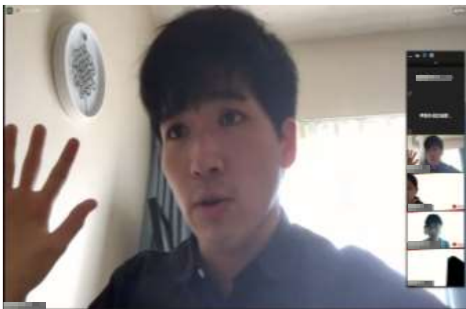
▲ディベート中の選手

新型コロナウイルス感染対策として、本大会ではディベートの準備段階から実際の試合までを全てオンラインで実施しました。各自が自宅などから Zoom で繋ぎ「日本は救急車を有料化すべきである」というテーマについて、午前と午後に一試合ずつ実施。選手たちは限られた時間の中で相手側の主張を理解し、スピーチをしなければならず、論理的思考能力、批判的思考能力、傾聴能力などが求められます。試合の判定は、運営により選出されたディベート経験豊富な審判が行いました。