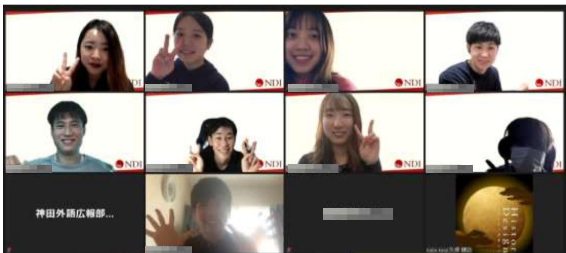
▲運営及び選手として参加した KUIS の学生9名