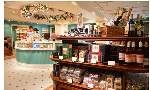
▲ ビクトリアンアレー