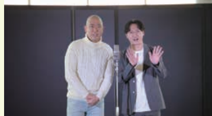
コロコロチキチキペッパーズ