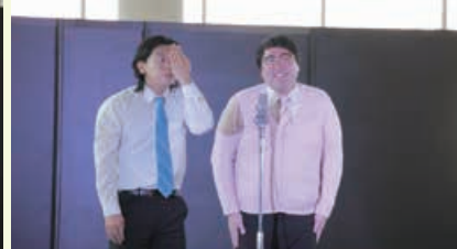
マチカルラブリー