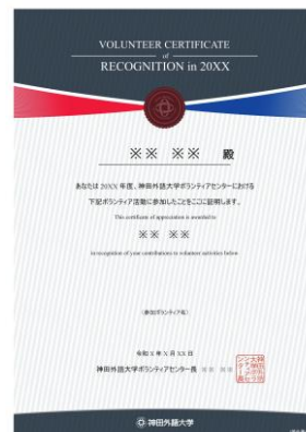
▲ ボランティア参加証(例)

また、会の最後には2023年度に実施されたボランティア活動の様子を垣間見ることができるスライドショーが上映され、本学学生がどのようなボランティア活動に参加し、どのような体験をしたのか、今後ボランティアに挑戦する学生へのヒントになりました。