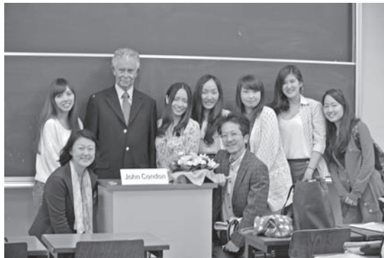
講演後、コンドン先生を囲んで